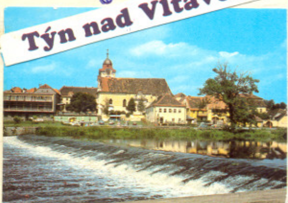
Týn nad Vltavou

Šli jsme se s Rajčákem a pěstek na nádraží. Došli jsme do čerany a / 111 Prostředce jsme přespali a měli kladem Tresor utopil Robinsona. K esus. Jsak jsme došli do tabat. Je celkem dobrá, až na to se škova vrazil na žutkové lodě. Pro man se pro něj vrazil, ale vrátil se pozdě v noci, bez něj. Běma jsme vyrobili slova a jeli na vltavě k Orlicku. Potom se vltavě objevil a tam chtěl křičovat, ale couvali jsme. Nakonec jsme se dostali k Orlicku, ale dělníci jsme nemohli najít, až když se člověk hodiny jsme je objevili s sátoce sa Orlickem. Po prohlídce jsme šli k autobusu, kde jsme blbli. Autobus nás zadvesl jinam než jsme chtěli a to je celkem konec