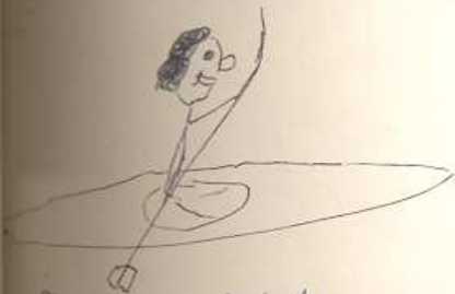
Traver na kajaku