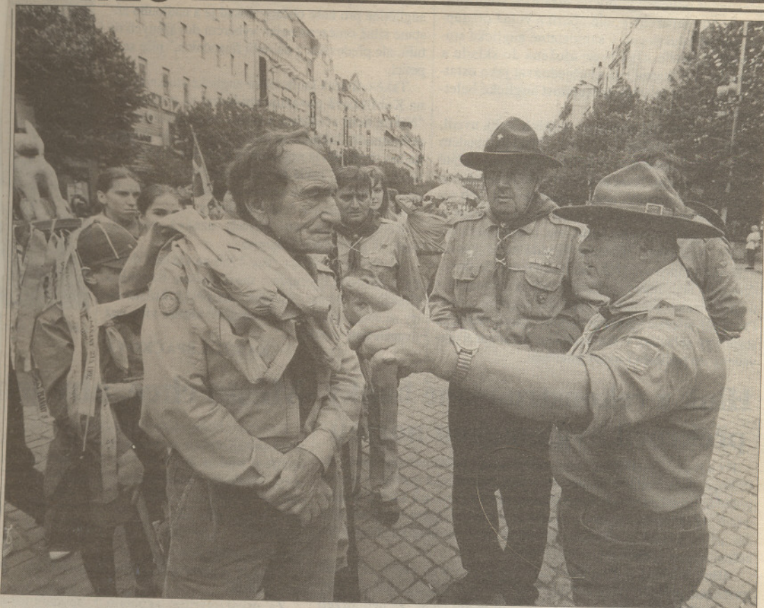
Skauti, kteří se účastní mezinárodního setkání, se v dolní části Václavského náměstí připravují k pochodu ulicemi města