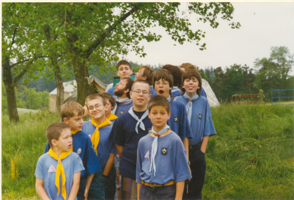
To sou noví ↑