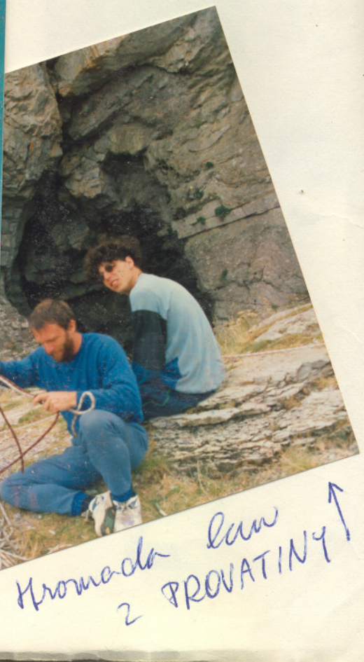
Hromada lan 2 PROVATINY ↑