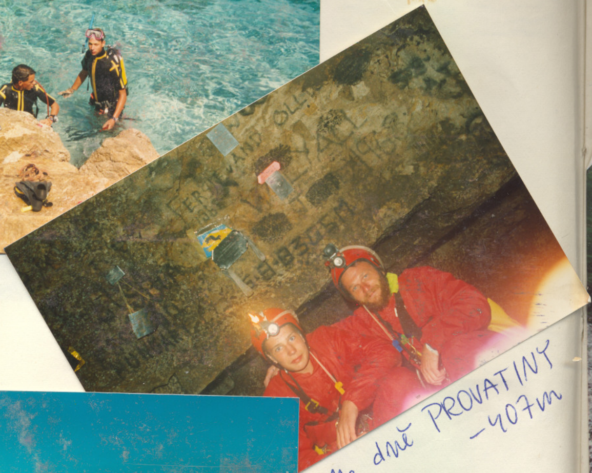
Na dně PROVATINY - 407m