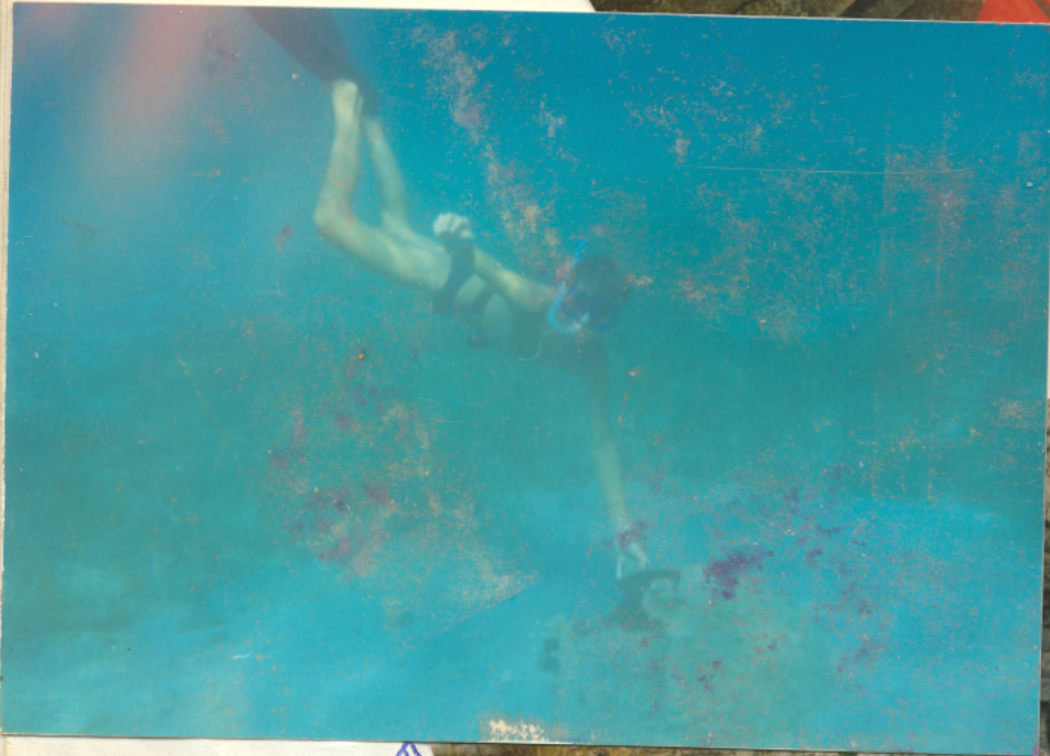
Na mořní mína na dně mořském ↑