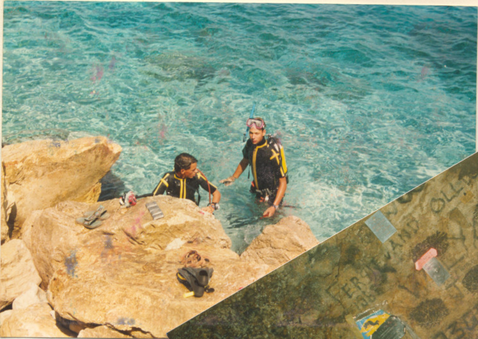
Trocha potápění ↑