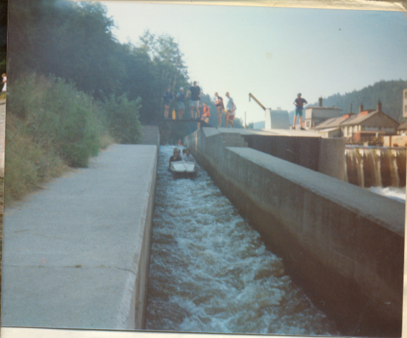
↑ ČESKÝ KRUMLOV (TO BYL JEZY)