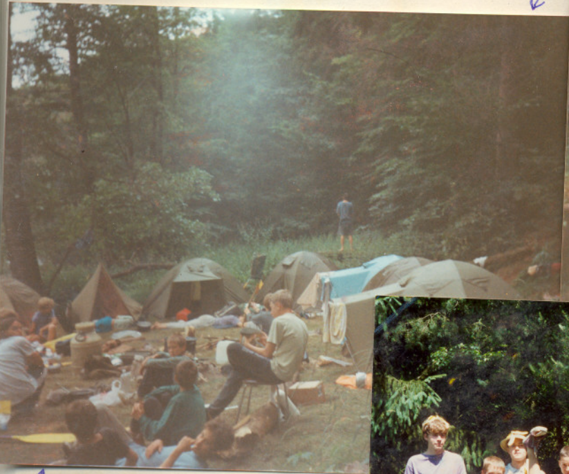
↕ TÁBOŘIŠTĚ: KDESI U ŘEKY